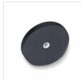
Ansicht auf Haftfläche